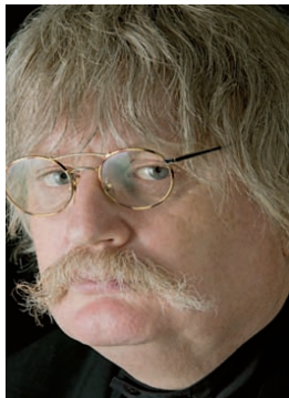
Karl Jenkins

World Premiere – 25. April 2000, Royal Albert Hall, London